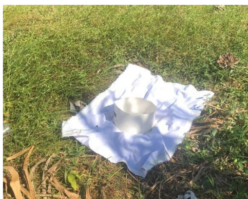
Figura 2 - Armadilha de sublimação de CO 2 , instaladas para atração de carrapatos nas áreas próximas à lagoa do IFMG, campus Bambuí

recipiente foi depositado ao centro de uma flanela branca medindo 1000cm 2 em cujas bordas foram coladas fitas adesivas, dupla face, largas, permanecendo no local por 40 minutos (Figura 2). Além do aspecto relacionado à produção do CO 2 , a pesquisa permitiu ainda avaliar o tempo dessa liberação, a partir do volume estipulado inicialmente, de modo a garantir futuras otimizações para a técnica, como atrativo para os carrapatos.