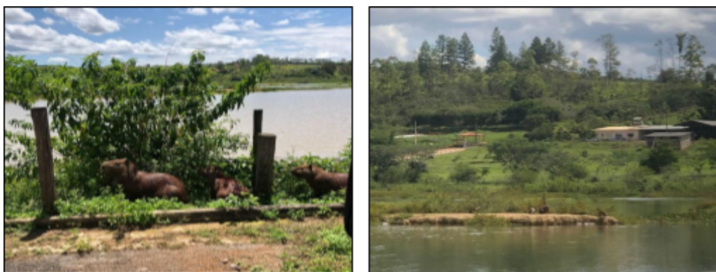
Figura 1- Lagoa habitada por capivaras ( Hydrochoerus hydrochaeris ) no IFMG campus Bambuí, onde foram instaladas armadilhas de sublimação para captura de carrapatos.

Os locais para as instalações foram definidos após visualização das capivaras ( Hydrochoerus hydrochaeris ), nos locais de trilhas e naqueles com presença de fezes, indicativo da prolongada permanência destes roedores para o descanso ou o forrageamento (Figura 1).